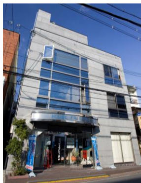
■松原本社：外観写真

2022年12月23日に東京証券取引所スタンダード市場に上場。同日に、福岡証券取引所本則市場に市場変更。近年は賃貸事業も展開中。