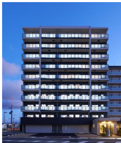
『FREEDOM residence 松原上田Ⅱ』