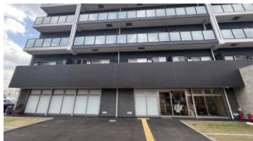
■本社外観(本社は1階フロアのみ)

2022年12月23日に東京証券取引所スタンダード市場に上場。同日に、福岡証券取引所本則市場に市場変更。近年は賃貸事業も展開中。