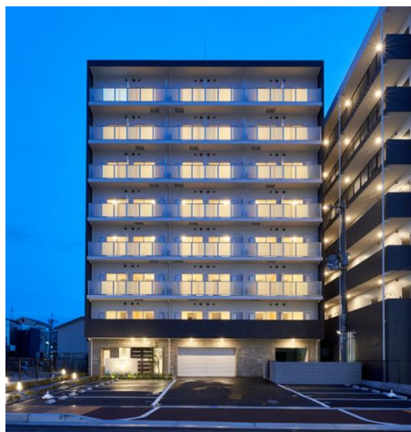
『FREEDOM residence 松原上田Ⅰ』