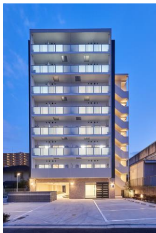
『FREEDOM residence 藤井寺岡』