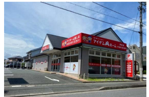
アイテムホーム浜松店

また、以前より進めておりました、沖縄県での新築一戸建住宅の供給を、当年より開始いたします。今後も需要の高いエリアへ進出、事業拡大を図ります。