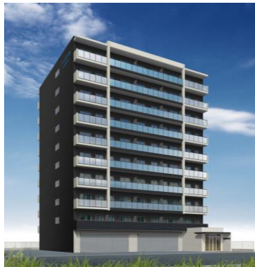
■FREEDOM residenceシリーズ イメージパース画像