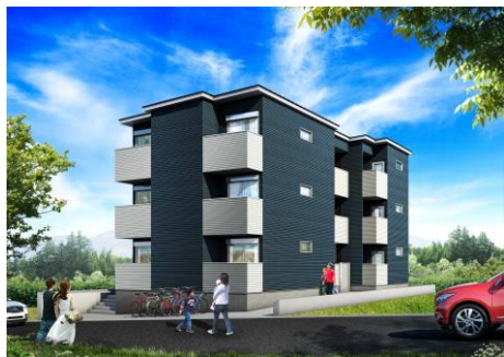
■「F+style(エフスタイル)」シリーズ イメージパース画像

当りリースのパース画像については現在作成中につき、完成後にご希望の記者様へのお渡しが可能になります。