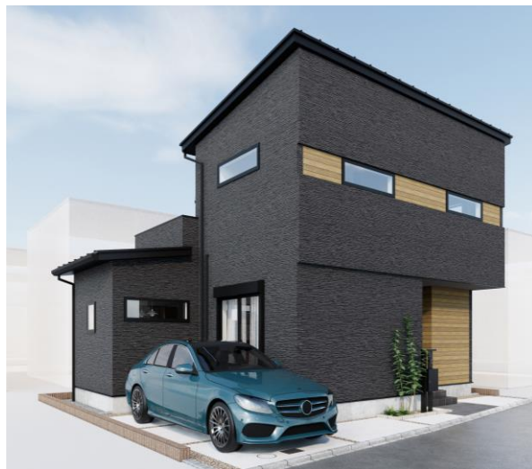
■完成イメージ：パース画像

当社では、今後も新築戸建て市場の活性化を図り、大阪府と福岡県に展開している他の分譲現場でも建売住宅(オープンハウス)を建築していく予定です。