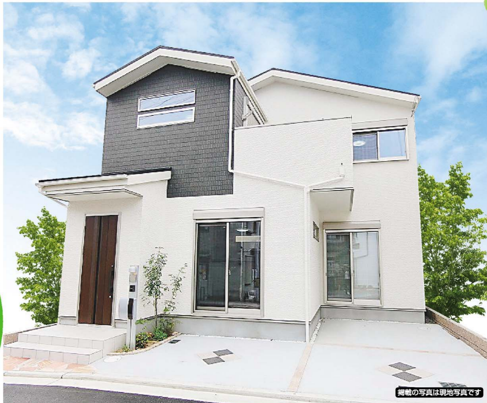
掲載の写真は現地写真です